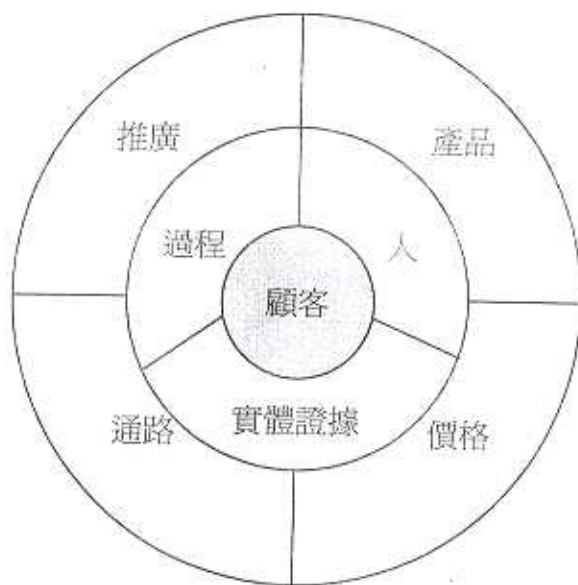
圖三：服務行銷組合